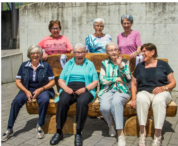
Die sieben Gründungsmitglieder.