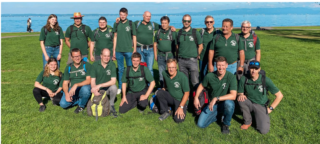
Die Reisegruppe der MGM am Bodensee in Arbon.

Kreuzlingen. Im Hafen wechselte der Verein das Verkehrsmittel und ging an Bord eines Schiffs. Einigen wenigen war es auf dem See etwas mulmig zu Mute. War es die Seekrankheit oder waren es eher die Nachwirkungen von der durchzechten Nacht? Jedenfalls brachte das Schiff alle wohlbehalten nach Stein am Rhein. Nach einem Fussmarsch durch die wunderschöne historische Altstadt machte sich der Verein noch rechtzeitig vor dem Regen auf den Heimweg nach Mettau. Bei einem frisch gezapften Bier aus dem Feuerwehrauto und einigen Grilladen liess der Verein das Wochenende ausklingen. Herzlichen Dank an die beiden Organisatoren für die unvergessliche Reise!