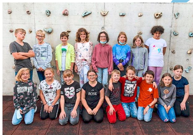
Die kreativen Schüler und Schülerinnen der Projektwoche stammen aus verschiedenen Schulklassen.

welche die Gemeinden bei der Planung von eigenen Aktionen unterstützen sollen.