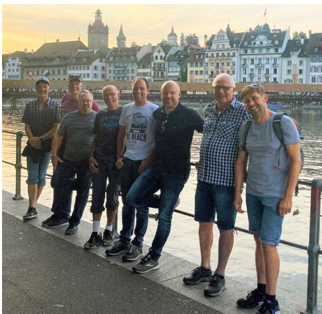
Reisegruppe vor der Kapellbrücke in Luzern.

Acht Mitglieder – fünf aktive, zwei Neumitglieder und ein Gast – waren pünktlich zur Prüfung der Verkehrstauglichkeit beim ehemaligen Gemeindehaus in Etzgen bereit. Nach der Prüfung und einem kleinen Parcours, der absolviert werden musste, konnte