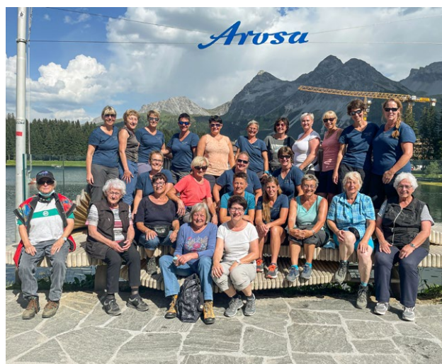
Der FTV Wil auf Jubiläumsreise.