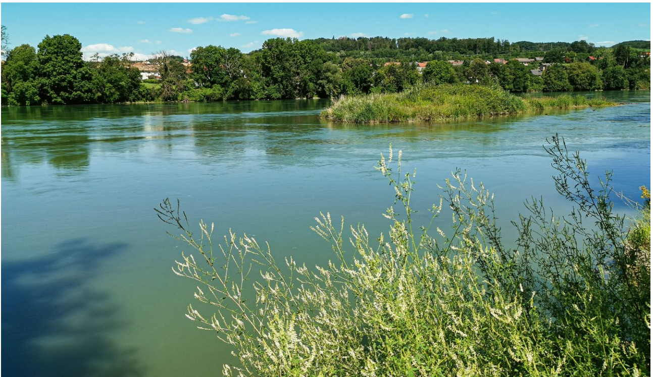
Am Rheinufer bei Etzgen.

Der Gemeinderat Mettauertal hat sich an den bisherigen Projektsitzungen beteiligt und ist an einer erfolgreichen Umsetzung des Projekts sehr interessiert.