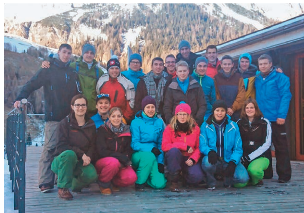
Die Teilnehmerinnen und Teilnehmer des diesjährigen Skiweekends kurz vor der Heimreise.