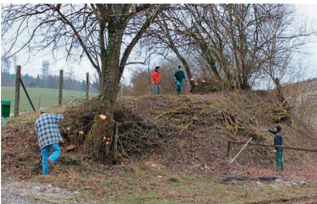
Platz schaffen für die Biodiversität.

25. Juni 2016, 18:30 bis ca. 22:30 Uhr Fledermausexkursion Sulz