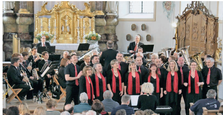
Der Chor StimmXvoll beim gemeinsamen Auftritt mit der Musikgesellschaft Wil.