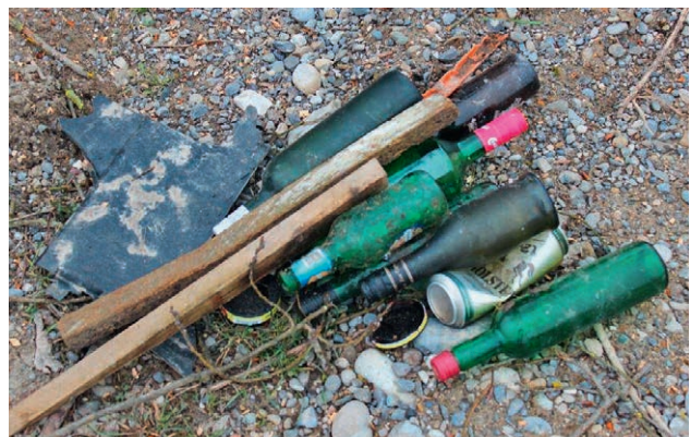
Littering, jetzt auch in Naturschutzgebieten.