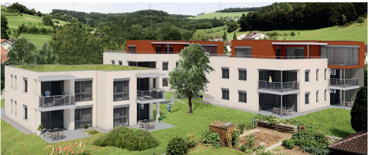
So wird die Überbauung Wilerhof nach der Bauvollendung aussehen.