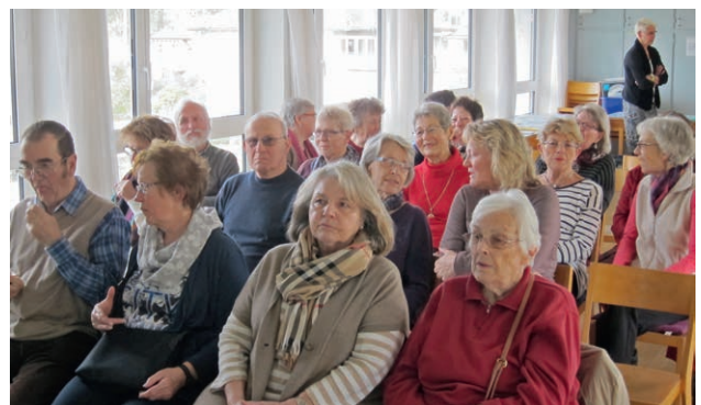
Interessierte Zuhörerinnen und Zuhörer.