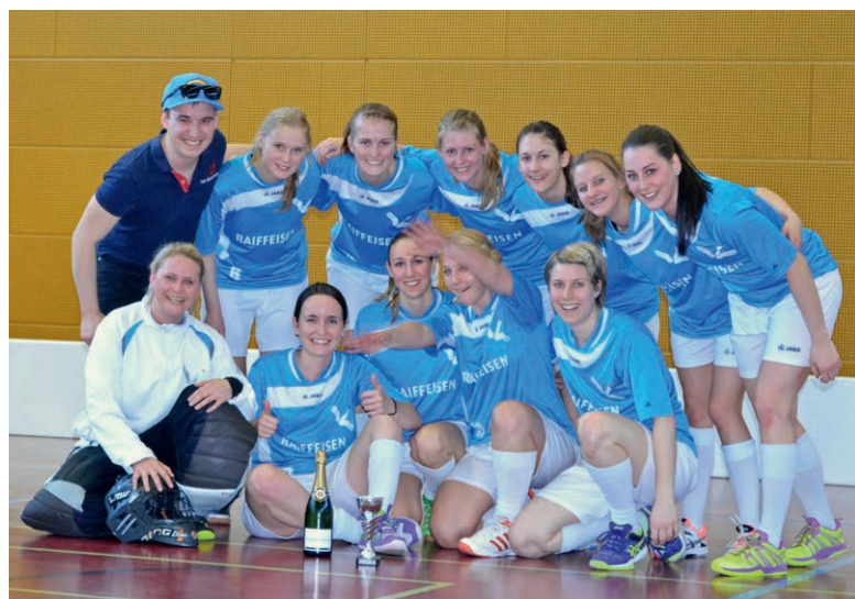
Freude herrscht beim Damenteam über den Gruppensieg.

Als fünftes Wild Goose Team gingen die Damen diese Saison in der 3. Liga auf Punktejagd. Das Damenteam, welches schon in der Vorbereitung auf die Saison im Cup Furore machte, in dem es das Erstligateam aus Bubendorf mit 12:9 besiegte, war auch in der Meisterschaft von Anfang an immer in der Spitzengruppe vertreten. Einzig die Damen aus Baden