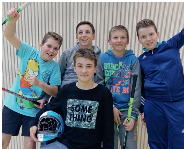
Die Jungs hatten sichtlich Spass.