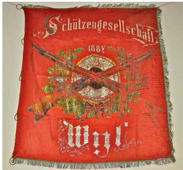
Diese Fahne der SG Wil aus dem Jahre 1887 wurde im alten Gemeindehaus beim Räumen gefunden.

Das diesjährige Feldschiessen findet statt am Freitag, 20.05. / Mittwoch, 25.05. / Samstag, 28.05. und Sonntag, 29.05. Der durchführende Verein ist der SV Gansingen.